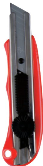
SL 3 P