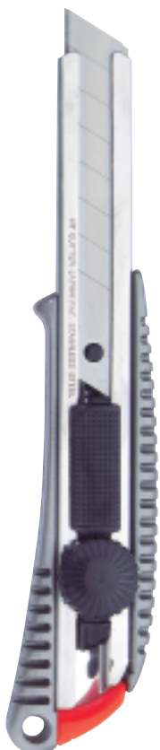
SL 600 GP